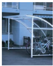
Garage à vélos