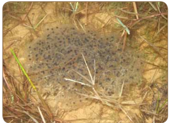
Pontes de Grenouille agile