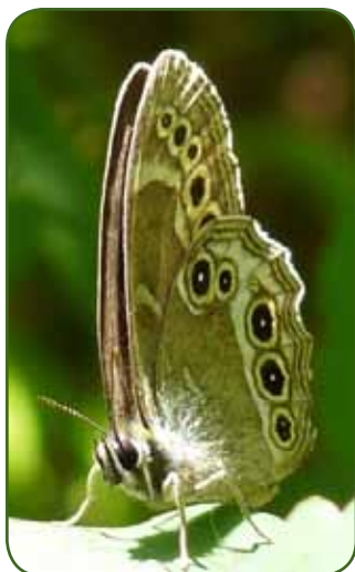
Bacchante observée dans le Frau en 2010

La Bacchante est une espèce qui a subi un déclin marqué au 20 ème siècle et dont la distribution actuelle est extrêmement fragmentée. La plupart des populations sont isolées, ce qui justifie les mesures de protection de son habitat spécifique. L'espèce est protégée sur l'ensemble du territoire français, ses habitats sont aussi protégés. Les chenilles consomment plusieurs espèces de graminées et de cypéracées, essentiellement Brachypodium sylvaticum , Brachypodium pinnatum , Molinia arundinacea , Carex alba et Carex montana . Les adultes ne butinent pas mais absorbent des matières organiques humides (sève, déjections...).