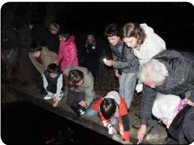
« Un dragon ! Au Jardin Bourian ? mais oui ! »

Après le diaporama, le groupe s'est déplacé auprès de la mare du Jardin Bourian, pour une visite nocturne. Sous le puissant faisceau lumineux de la lampe de Muriel, chacun a pu découvrir dans l'eau des Grenouilles agiles ainsi que plusieurs pontes, signe, d'après la spécialiste, de la présence de plusieurs femelles. Les tritons palmés mâles ont pu être distingués des femelles au ventre rebondi, porteur des futurs œufs. Une larve de Salamandre, espèce qui se raréfie, reconnue grâce aux petites taches blanches qui marquent la naissance de chacune de ses pattes.