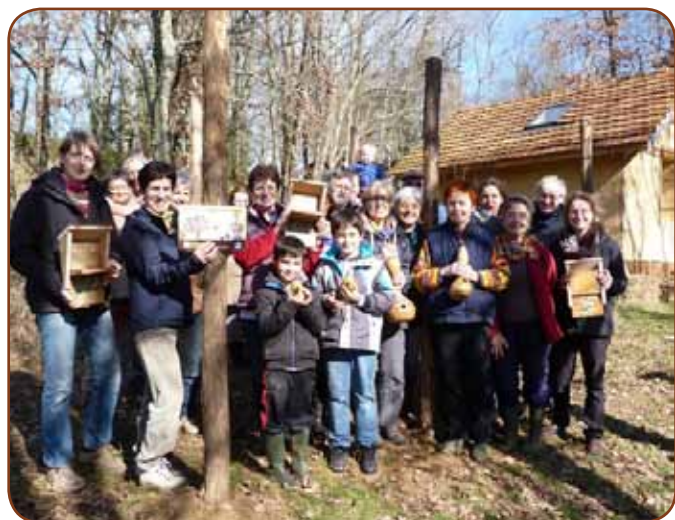
Fabrication du gîte à Hérisson (ci-dessus à gauche) et présentation des nicoirs et supports pédagogiques réalisés