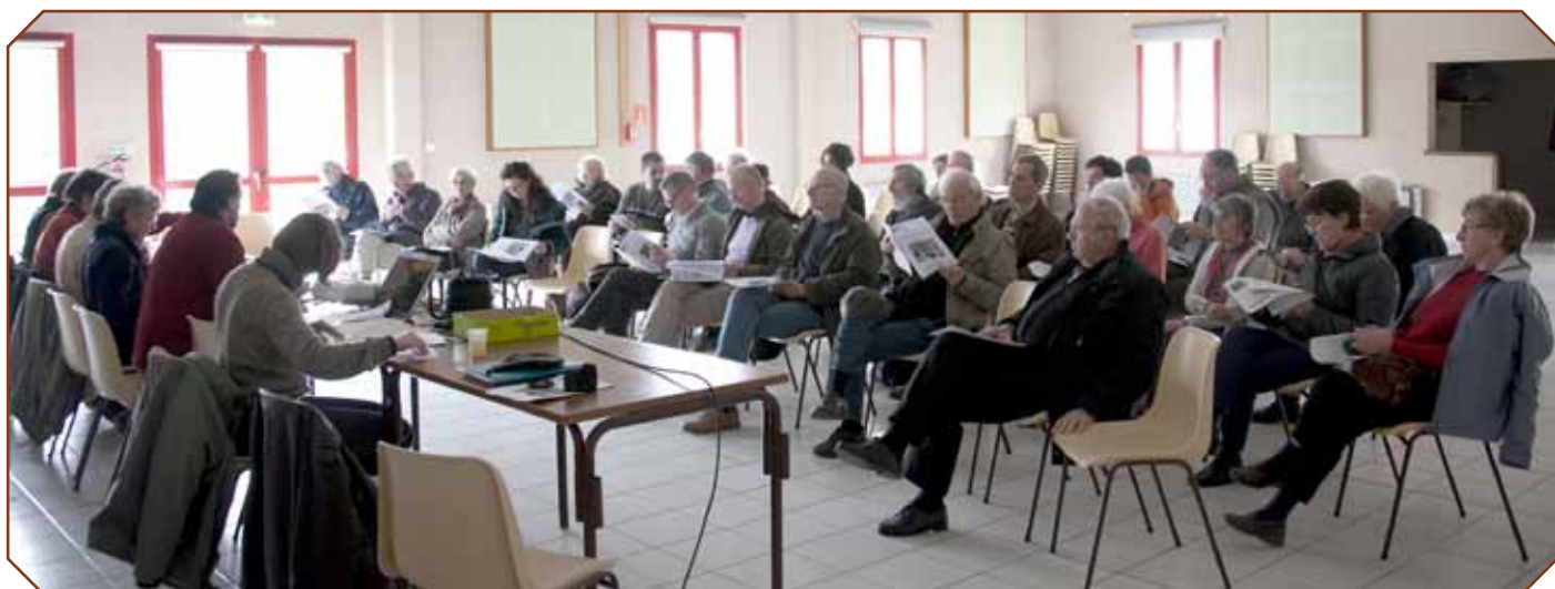
Assemblée Générale de la LPO Lot le 29 mars 2014, à Saint-Géry